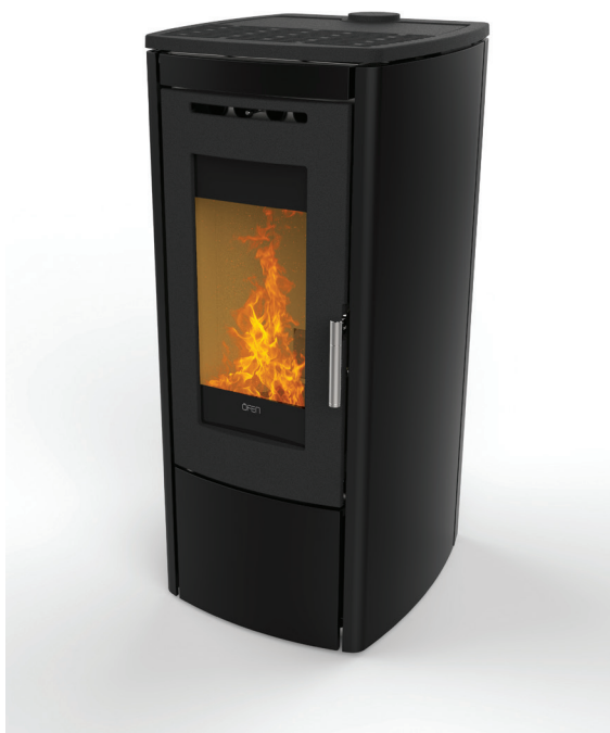
Finition : laqué noir, blanc perle ou bronze (option)