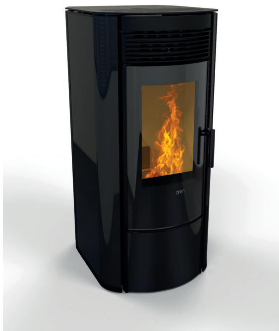
Finition : Verre trempé noir en façade et sur les côtés